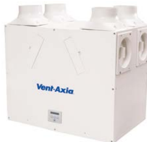
Kinetic B Plus